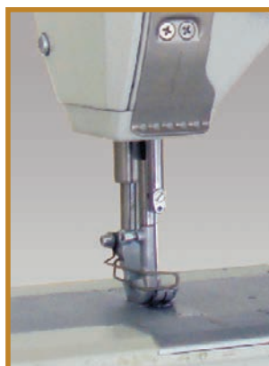
MACCHINA PIANA STANDARD