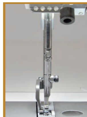
VP 867 + 3 cm DELTA